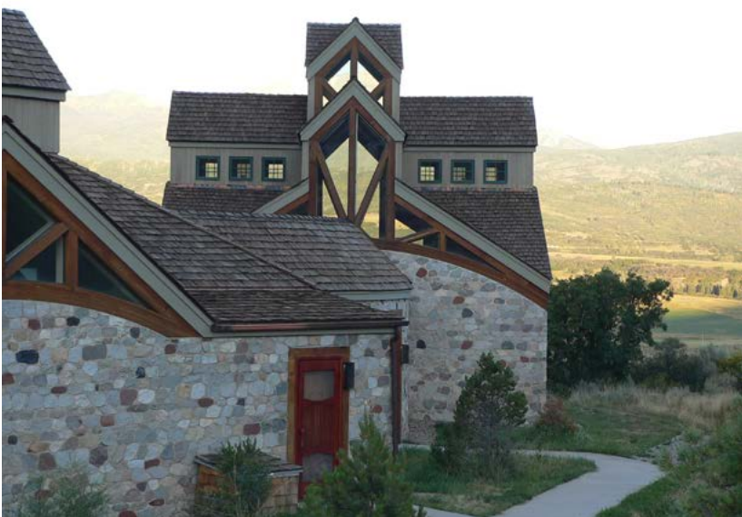
unten links und rechts: Das Benediktinerkloster von Snowmass, Colorado