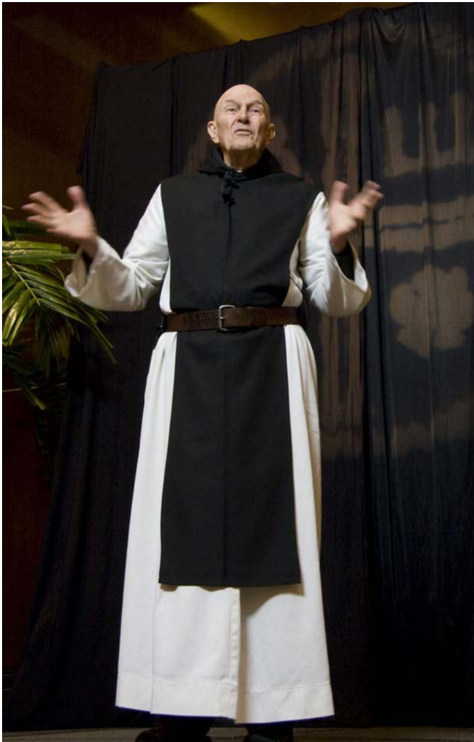
Trappisten-Mönch Thomas Keating

»Sollte es nicht möglich sein, aus der ganzen christlichen kontemplativen Tradition eine aktualisierte Meditationsmethode zu machen, die für Laien in ihrem Alltag praktikabel ist?«